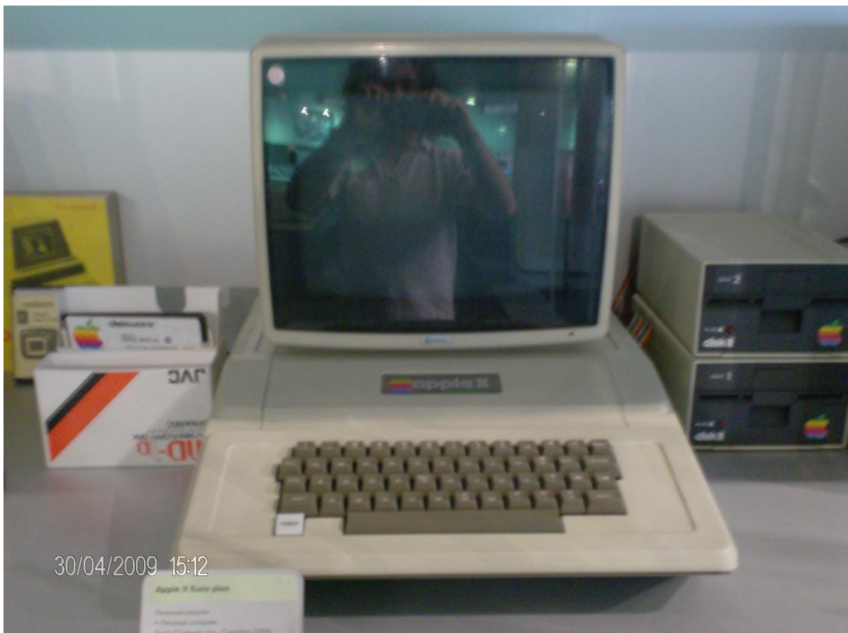
(Photo 1) Apple II Euro Plus – 1978 , Apple Computer Inc. Cupertino(USA) , Technisches Museum Wien.